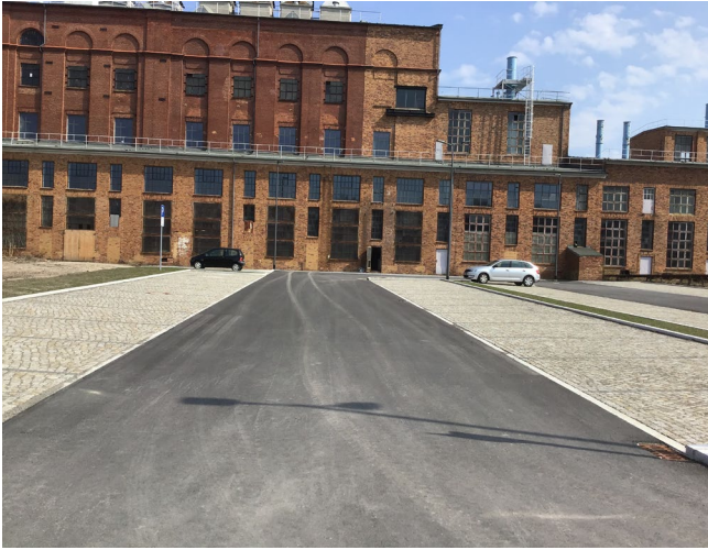
Besucherparkplatz Energiefabrik Knappenrode