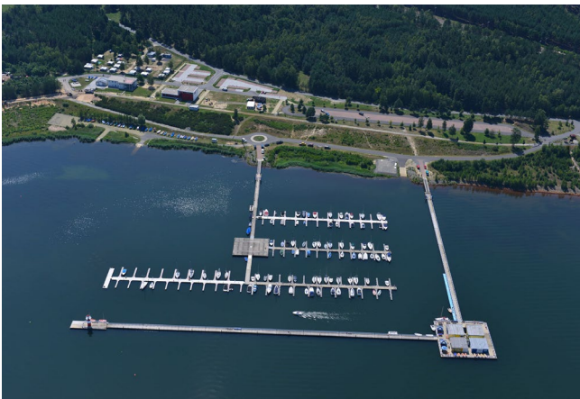
Erschließungsgebiet Klitten - Jasua