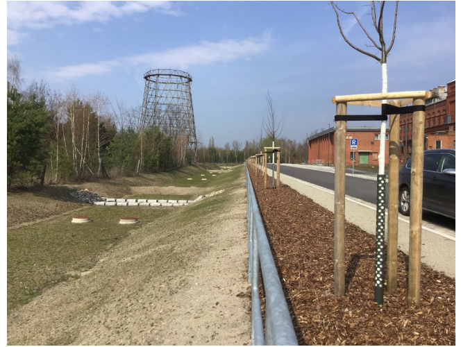
Erschließung Energiefabrik Knappenrode