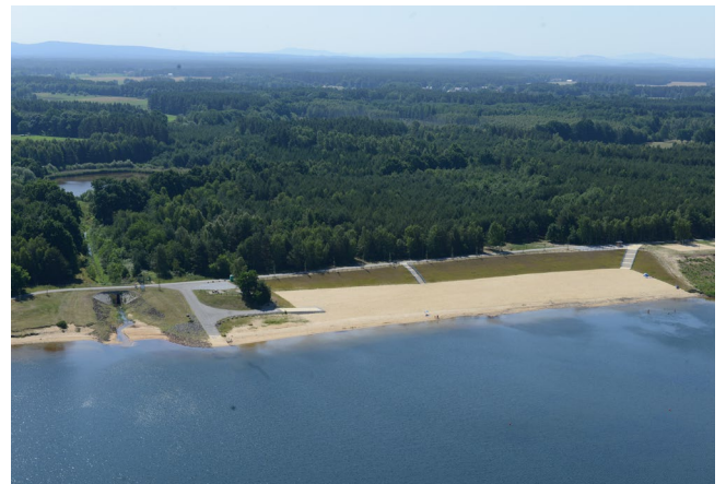
Badestrand Klitten am Bärwalder See