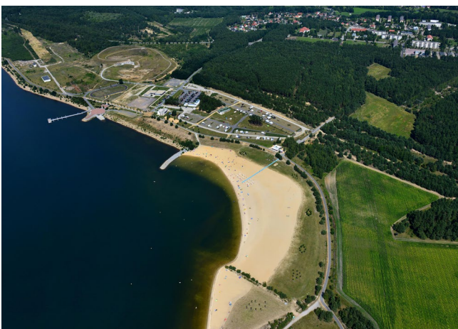
Sternencamp Bärwalder See